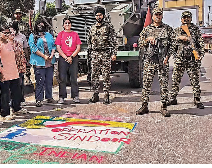
'ఆపరేషన్ సింధూ' మొదటి వార్షిక వార్షికోత్సవాన్ని పురస్కరించుకుని గురువారం ఉద్యోగులలో చేసిన రంగవల్లక వద్ద భద్రతా సిబ్బందితో విద్యార్థులు